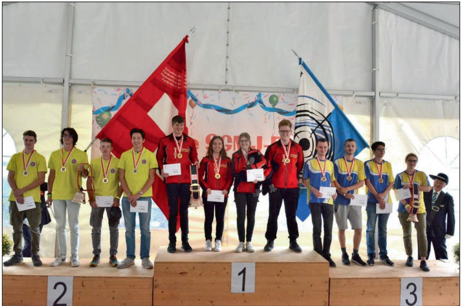
Podest Jungschützen U21 Airolo (Silber, links), Einsiedeln (Gold, mitte), Bürglen (Bronze, rechts)

Besonders stark zeigten sich die Nachwuchsschützen der Feldschützengesellschaft Richenthal. Die Zuschauer dürften die Gruppe wohl nicht zu den Favoriten gezählt haben. Denn im letzten Jahr konnten sie sich nicht für den Final qualifizieren. Es scheint, als hätten sie die Auszeit gut genutzt und viel Kampfgeist mitgebracht. Denn trotz eines Scheibenfehlers konnten sie sich mit 533 Punkten die Goldmedaille sichern. Sie lagen mit acht Punkten Vorsprung vor der reinen Frauenmannschaft der Militärschützengesellschaft Guggisberg und der Schützengesellschaft Krattigen.