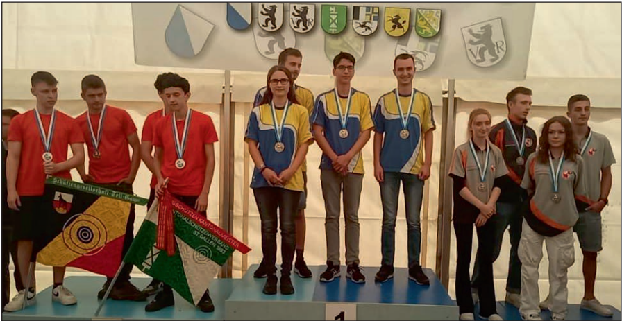
Die U21 Gewinnergruppen der OJGM: Gams (Silber, links), Bürglen (Gold, mitte), Mauren-Berg (Bronze, rechts)

Die weiteren TG-Teilnehmer in der Rangliste: